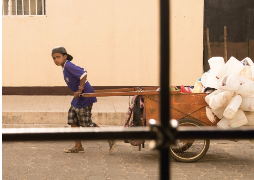
“Niño trabajando” (Nicaragua). Foto digital, 2016.