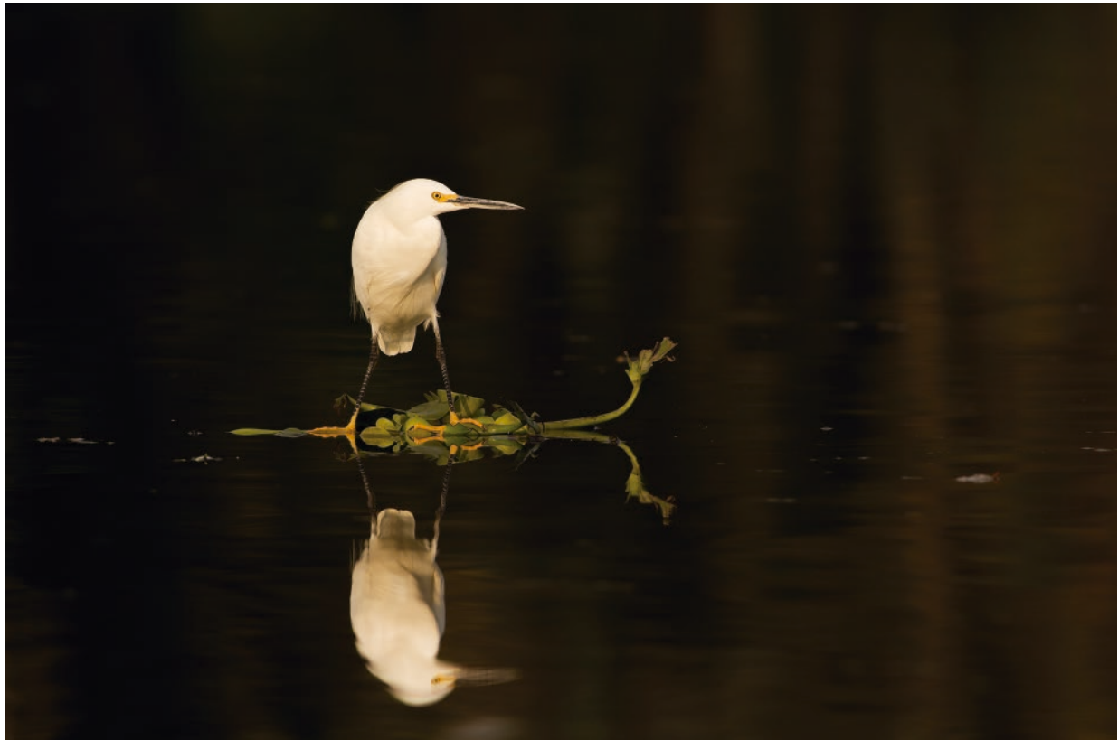
"Canoa". Foto digital, 2017.