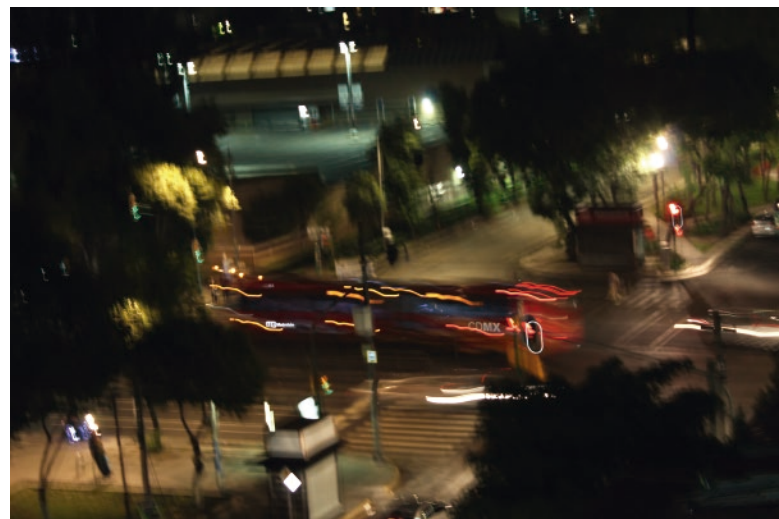
“Ciudad nocturna 1”

Licenciada en Ciencias Computacionales por la Universidad Autónoma de Nuevo León. Ha realizando pinturas surrealistas, paisajes, retratos, etc, y ha presentado varias exposiciones individuales, entre ellas “Tensión superficial” en Galería Albricci en Saltillo. Ha sido seleccionada en la “1er Bial Nacional de Autorretratos Rubén Herrera” en el Museo Rubén Herrera; y actualmente es seleccionada en la exposición de la V Bial de Arte Sacro a llevarse a cabo el 29 de noviembre en Monterrey.