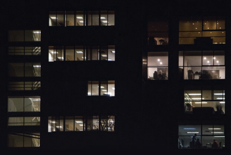
"7:30pm en la oficina", de la serie "¿Dónde estamos? Caos y silencio". Foto Digital, 2016.

Arquitecta por la Universidad de las Américas Puebla (2009-2014), Diplomado en Fotografía por el Gimnasio de Arte y Cultura (2015-2016) y Diseñadora Gráfica freelancer. Para Yaatzil, hacer fotografía es transformar un momento cotidiano efímero en un instante extraordinario permanente. Es por esto que cada una de sus fotografías es sensible, intensa y única.