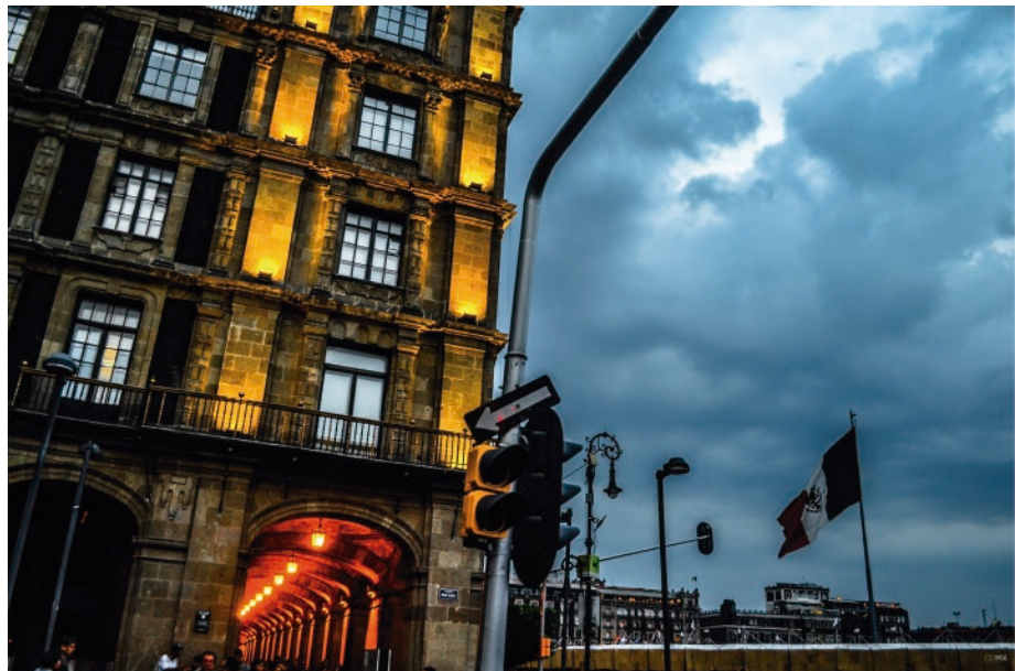
“Zócalo en Color” Foto digital, 2016.

Arquitecto por profesión, fotógrafo por pasión. Nacido en Chihuahua, Chih. en 1988, busca capturar momentos con una sinergia entre el objeto, iluminación, perspectiva e historia.