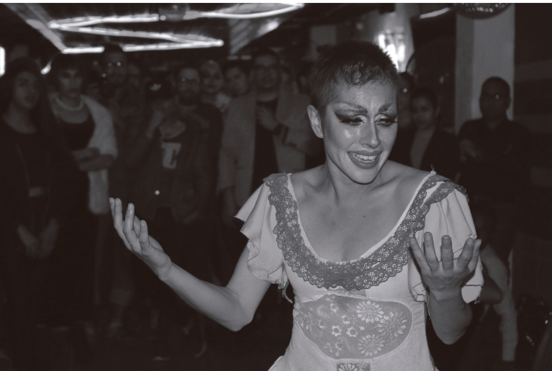
Fotografías de la Serie “Posibilidad” Foto digital, 2017.

“Sé libre en tu mundo, deja ser libre a quienes llegan y comparten contigo parte de su devenir. Aprovecha los idiomas del cuerpo, de la palabra y de las mentes que llenarán tu monstruosidad. Hazlos parte y otorga una parte de ti, acepta el trueque vivencial de compartir. Y entonces te rompes, te reconstruyes y vuelves a rena(ser). Duele, tendrás miedo, renunciarás, dudarás, pero jamás te sentirás más vivx.”