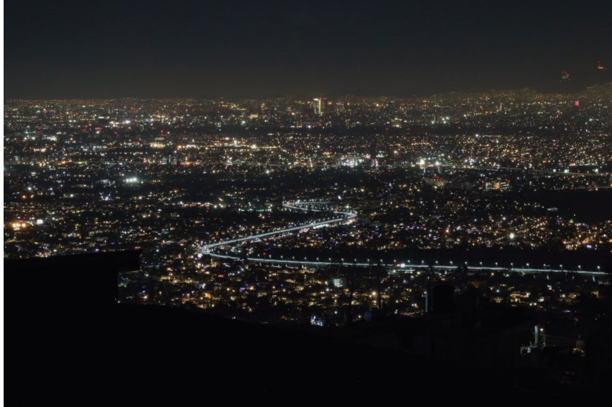
“Fragmento”. Foto digital, 2017.