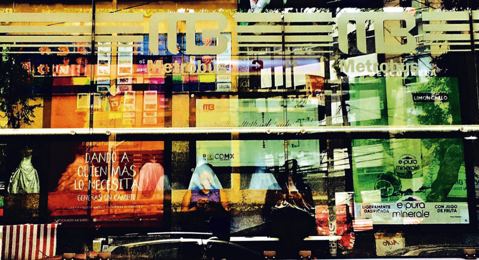
De la serie "Ciudad Pop". Foto digital. 2017

Presentó su exposición +CARAS en diferentes recintos de la CDMX. En el 2013 se presentó en la exposición ARTE 40 en su 5ª edición, con sede en La Esmeralda y en el Museo Nacional de las Artes. Del Cielo y la Tierra, es la actual exposición individual del artista, presentada en el Centro Cultural Pedregal, en la Galería 557.