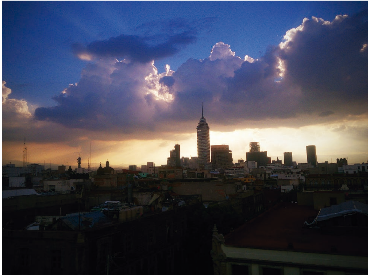
“Curiosidades y recuerditos” 2016