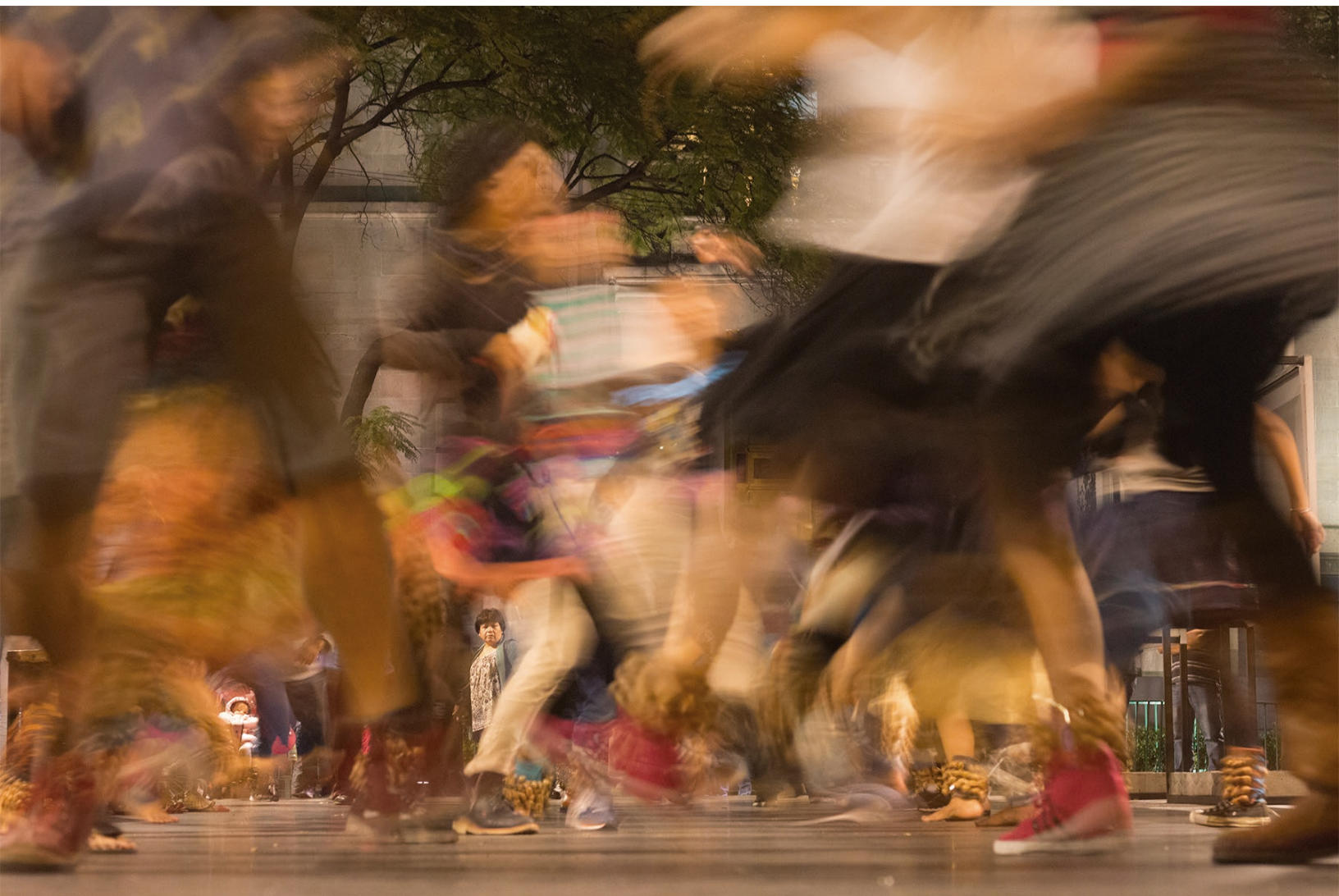
“Huellas de lo etéreo”. Foto digital, 2016.

Nace en Toluca, Estado de México, siempre se apegó a las artes visuales siendo el óleo su técnica favorita desde pequeño. Ingresó a la carrera de Ciencias de la Comunicación en la UNAM, donde descubre su pasión por la escritura y el cine, sin embargo, el devenir lo llevó al mundo de la publicidad, encargado de cuentas como De Película HD y Golden Edge, ambos canales televisivos de cine. Fue hasta su proceso de titulación donde descubre a la fotografía como medio de expresión, la cual le da un rumbo nuevo a su vida al abrir un panorama completo hacia la narrativa visual y una nueva forma de retratar la realidad y contar historias.