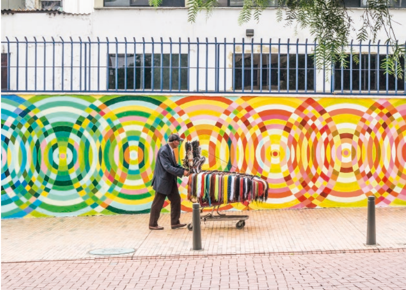
“Sobreviviendo a colores” (Colombia) Foto digital, 2015.