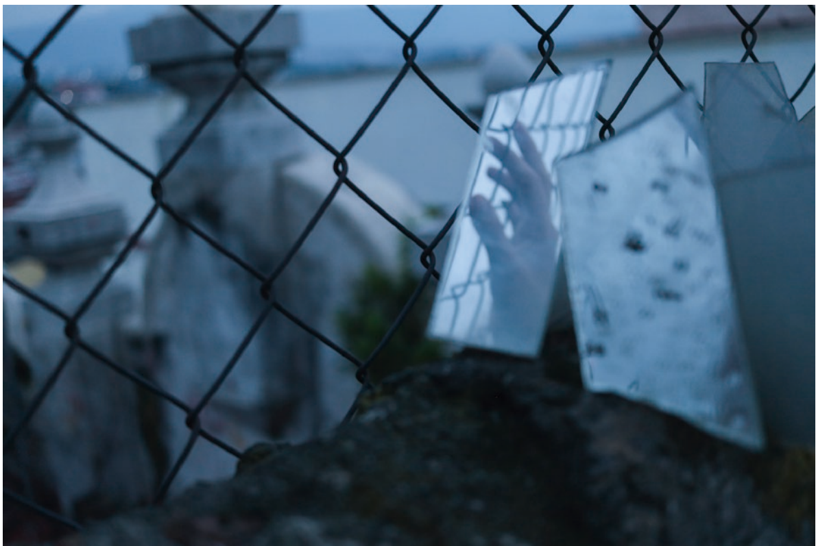
“Ausencia” Foto digital, 2017.

Originaria de la CDMX. Estudió Fotografía en la Lic. en Artes en la Facultad de Artes de la UAEM. Le interesa abordar lo onírico, el cuerpo y el tiempo tanto en sueños como en episodios de ansiedad. Su herramienta principal es la fotografía pero también indaga en la experimentación interdisciplinaria entre la gráfica y la fotografía. Se ha presentado en la XV Feria Internacional del Libro en el Zócalo con un libro de artista y en ferias de fanzines como: Válvula de escape en 2016 y en el 8vo Fanzinorama en 2015. En 2016 su trabajo participó en el 1er Festival Internacional de Corporalidad Expandida en Argentina. Actualmente colabora con la asociación INCUDESOS.