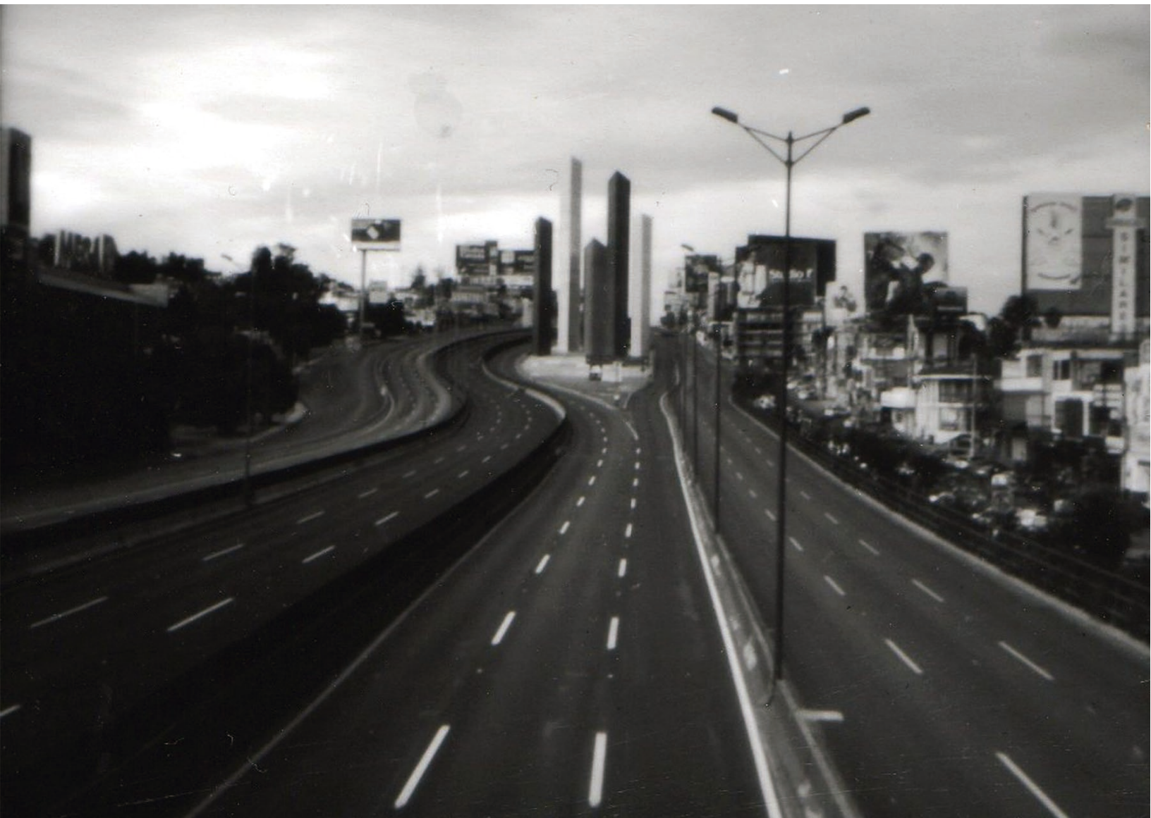
"Torres" de la Serie "Rastros Urbanos". Foto análoga, cámara estenopeica, 2015.