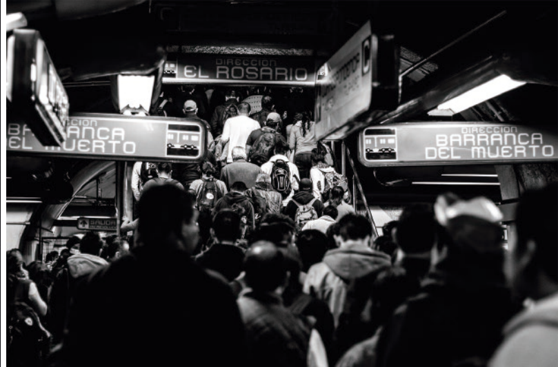
"7:30pm en el metro", de la serie "¿Dónde estamos? Caos y silencio". Foto Digital, 2016.