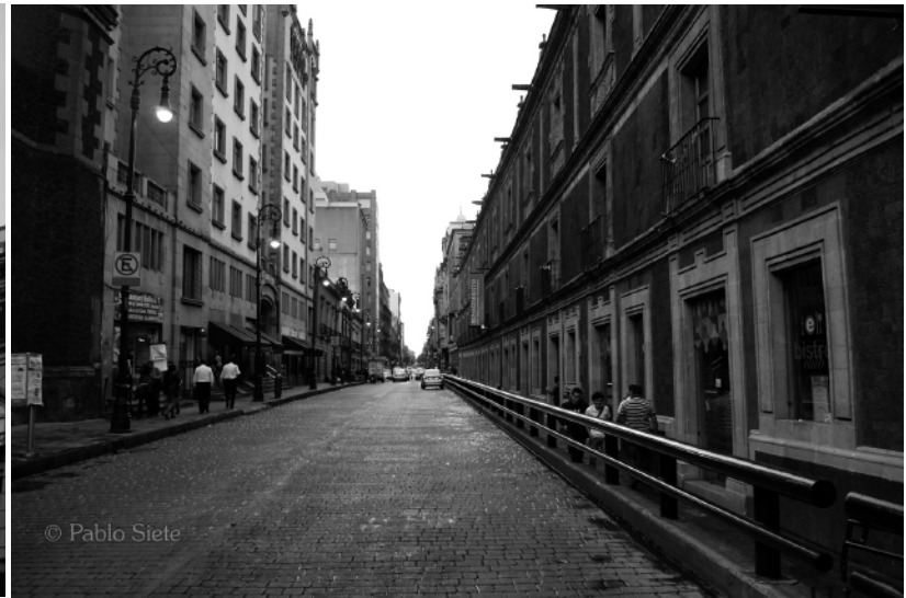
De la serie "Ciudad de México" Foto digital, 2014-2017.