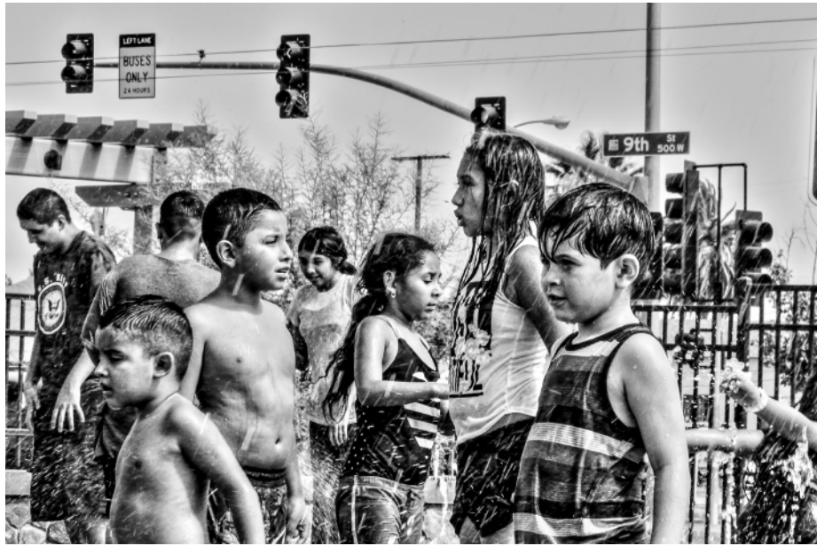
“Nueve”, Foto digital.

Maestra en Ciencias Químicas y artista visual. En el ámbito de las artes se ha desarrollado de forma multidisciplinaria, exponiendo en festivales de México, Estados Unidos y España. Actualmente se dedica a la docencia continuando a la par con su producción artística. A la fecha ha escrito algunos artículos de divulgación, crítica de arte y poesía para diferentes revistas internacionales.