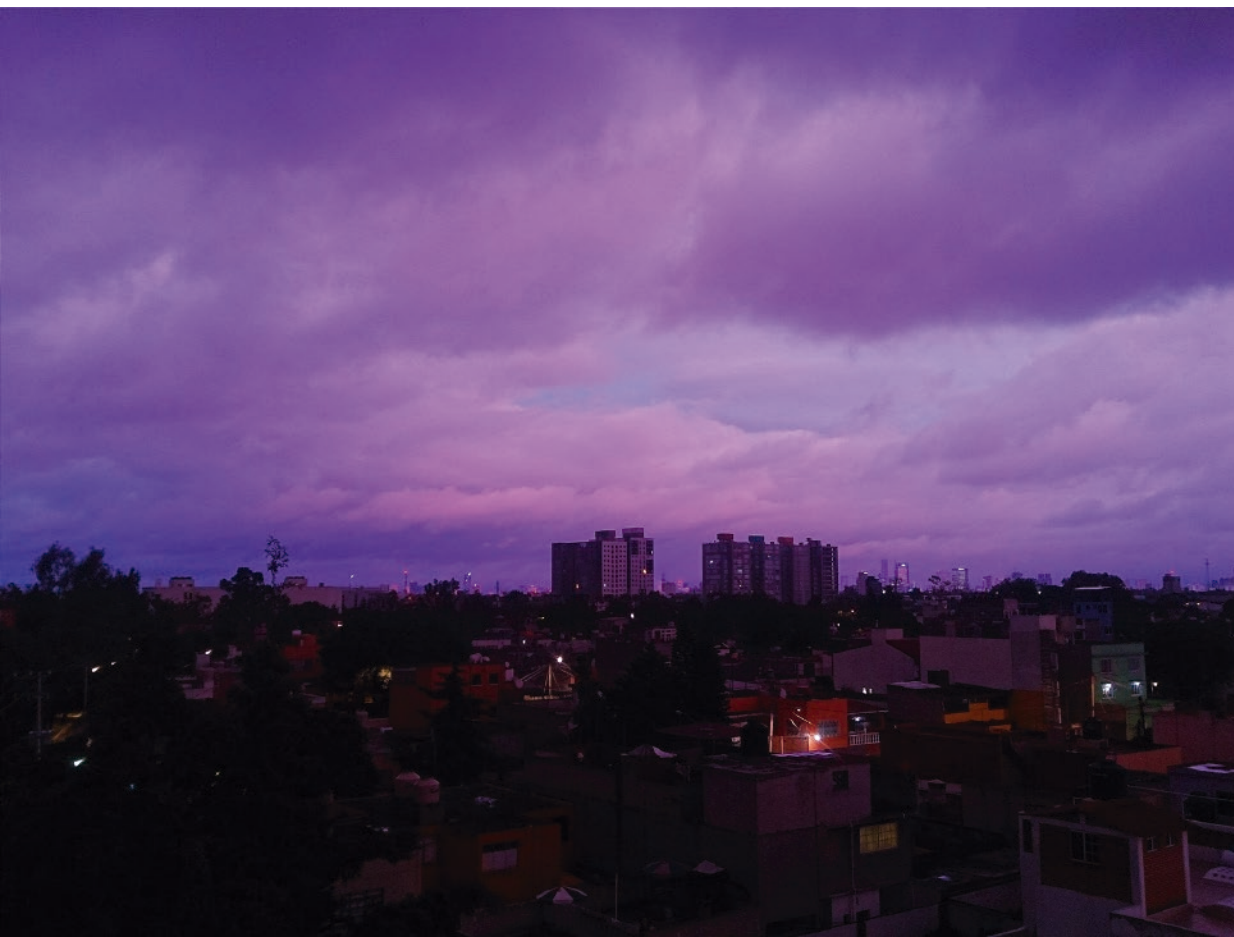
“Belleza tétrica” 2016