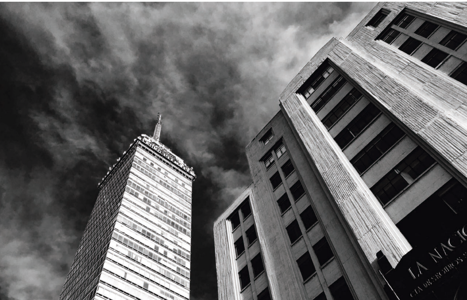
“En las nubes”. Foto digital. 2016.