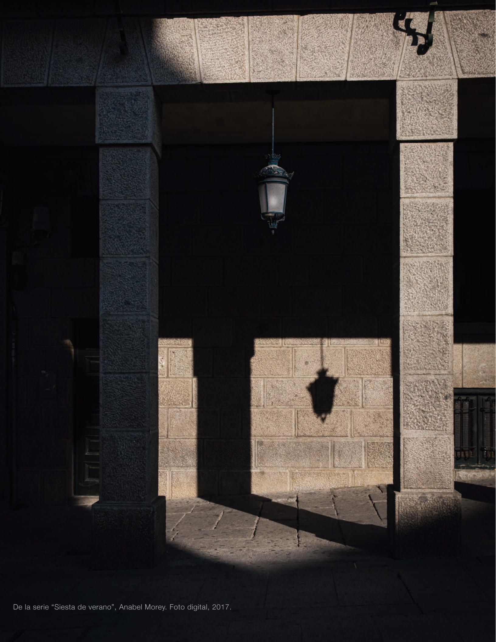
De la serie "Siesta de verano", Anabel Morey. Foto digital, 2017.