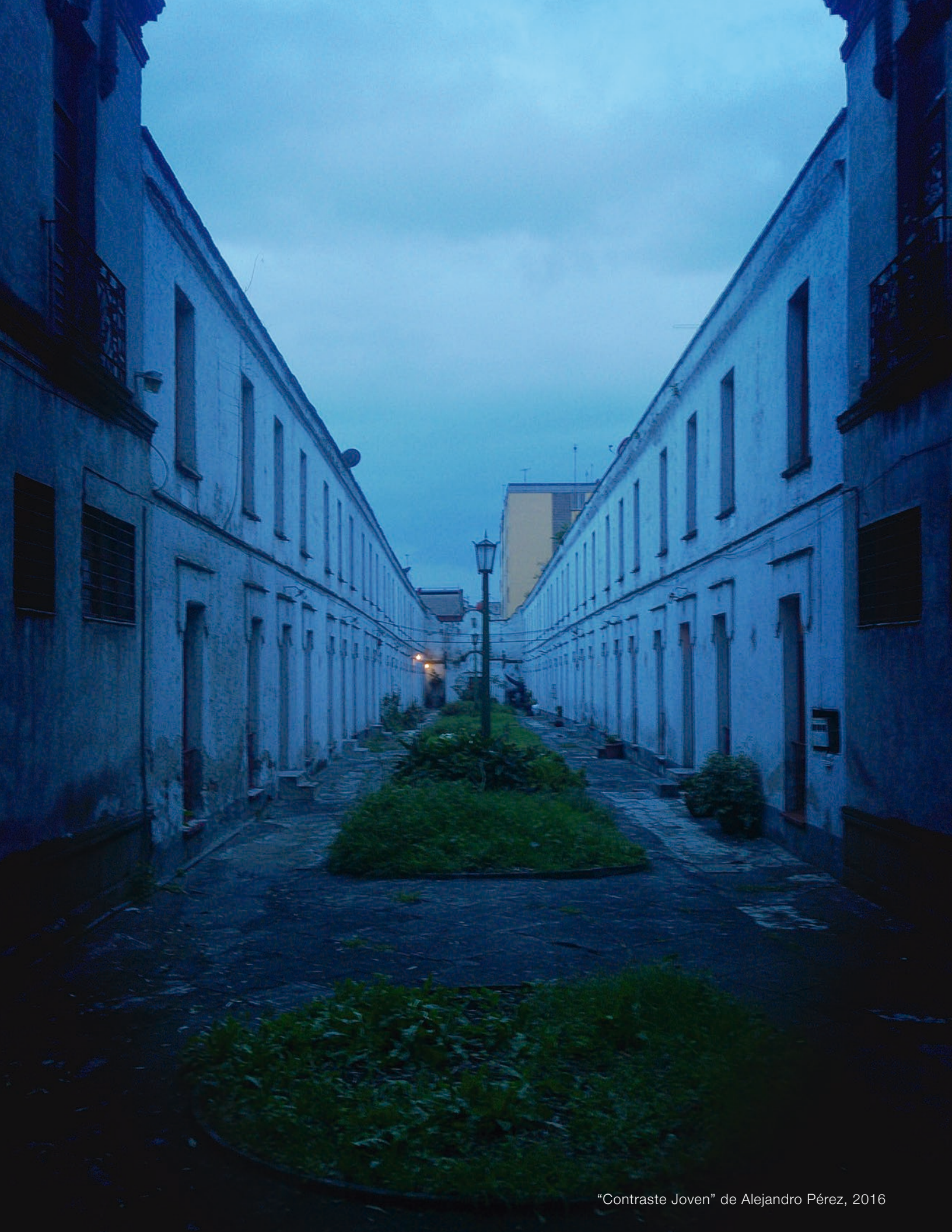
"Contraste Joven" de Alejandro Pérez, 2016