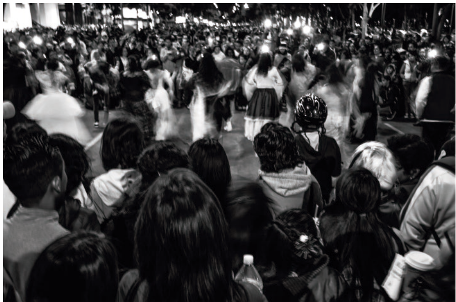
“Folklor Callejero” Foto digital, 2016.